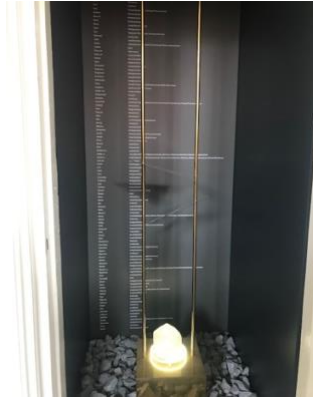
De kast met adressen en namen van weggevoerde gezinnen in het EHC, Deventer

Een directere verbinding met Joodse huizen is nauwelijks denkbaar: iedereen ziet dat de Holocaust niet ver weg was maar 'hier' plaatsvond, 'bij mij om de hoek'. Voor schoolkinderen wordt de foto begeleid door een lespakket over 'Vluchten, vroeger en nu'. Na afloop van de les wordt er een klassefoto gemaakt van de kinderen die aan de les hebben deelgenomen.