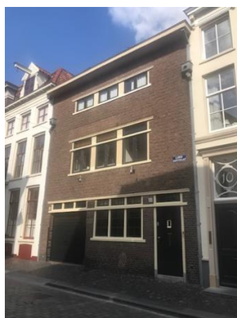
Het pand Lange Hofstraat 12